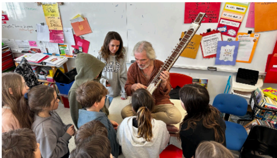
Les jeunes ont eu droit à un concert de sitar.